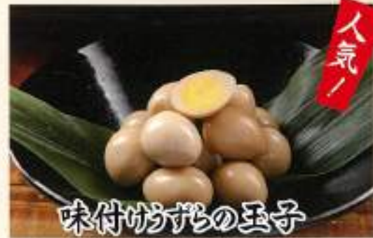
味付けうずらの玉子