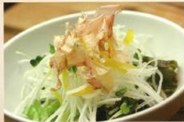
だいこんダイコン 大根サラダ 399円