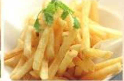
やっぱりポテトフライ