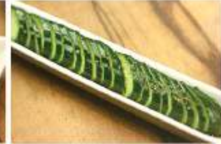
あっさりしろきゅう