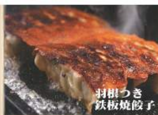
羽根つき 鉄板焼餃子