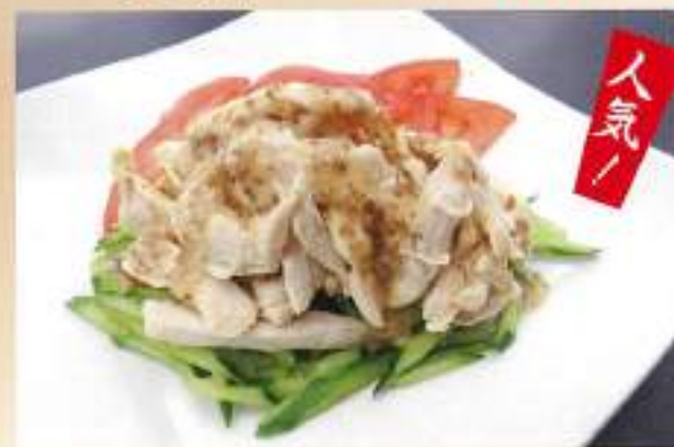
棒棒鶏 599円 バンバンジー