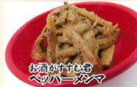
お酒がすすむ君 ペッパーメンマ