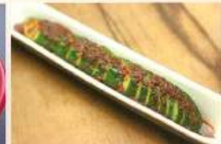
ひりっとあかきゅう