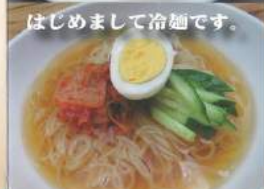
はじめまして冷麺です。